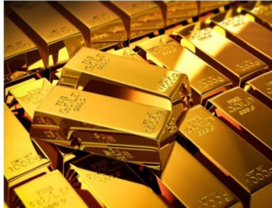
Инвестиции в золото