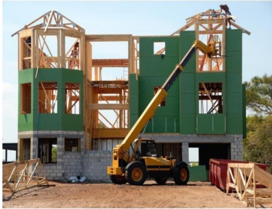
Инвестиции в недвижимость