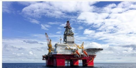
Нефть и газ